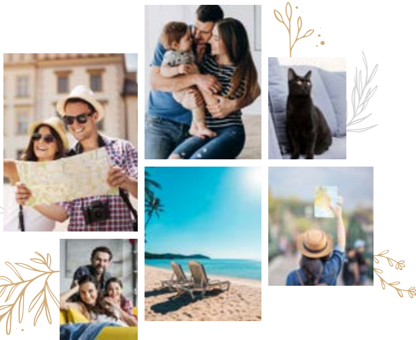
Foto tamaño 6x8, Foto tamaño 4x6, Foto tamaño 4x4, Foto tamaño 5x5, Foto tamaño 5x7, Foto tamaño 6x6, Foto panorámica 6x14, Foto panorámica 6x20